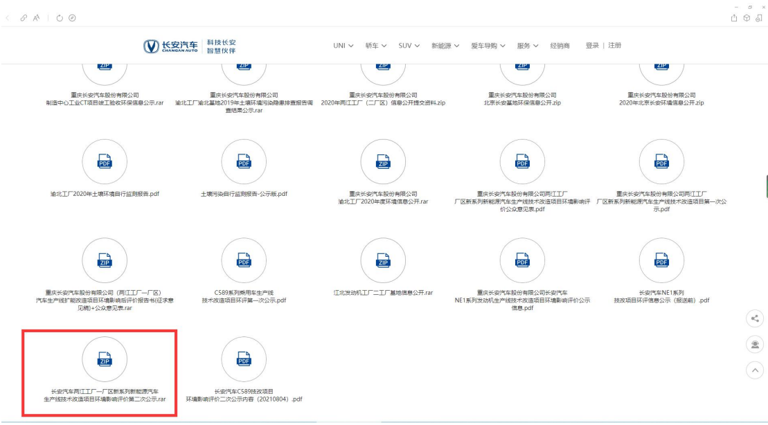
图 3-1 征求意见稿网上公示截图

我 公 司 于 2021 年 8 月 3 日 在 公 司 官 方 网 站 ( https://www.changan.com.cn/commonweal-hjxx.shtml ) 进行了征求意见稿 内容公示，公示网页截图如下：